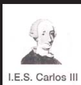
I.E.S. Carlos III