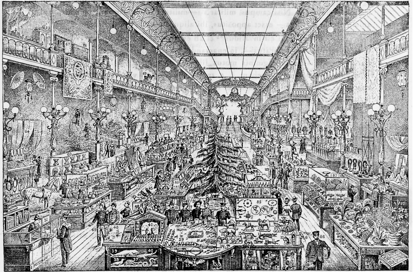
PICTURA 21. a

Magnum receptaculum - Taberna universalis mercium - Crepundia