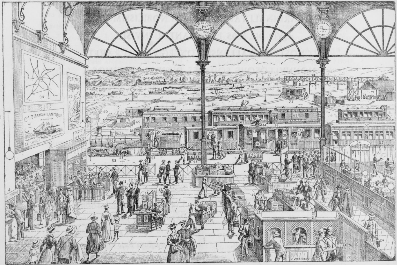
PICTURA 17. a