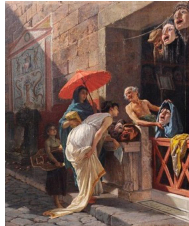
Cesare Mariani, El vendedor de máscaras (1875)